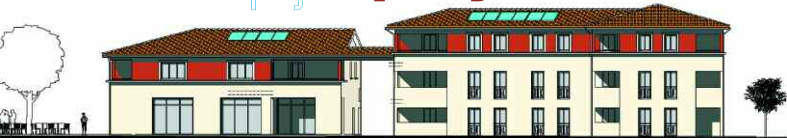
FACADE SUB COLLECTIF 3 ET 5