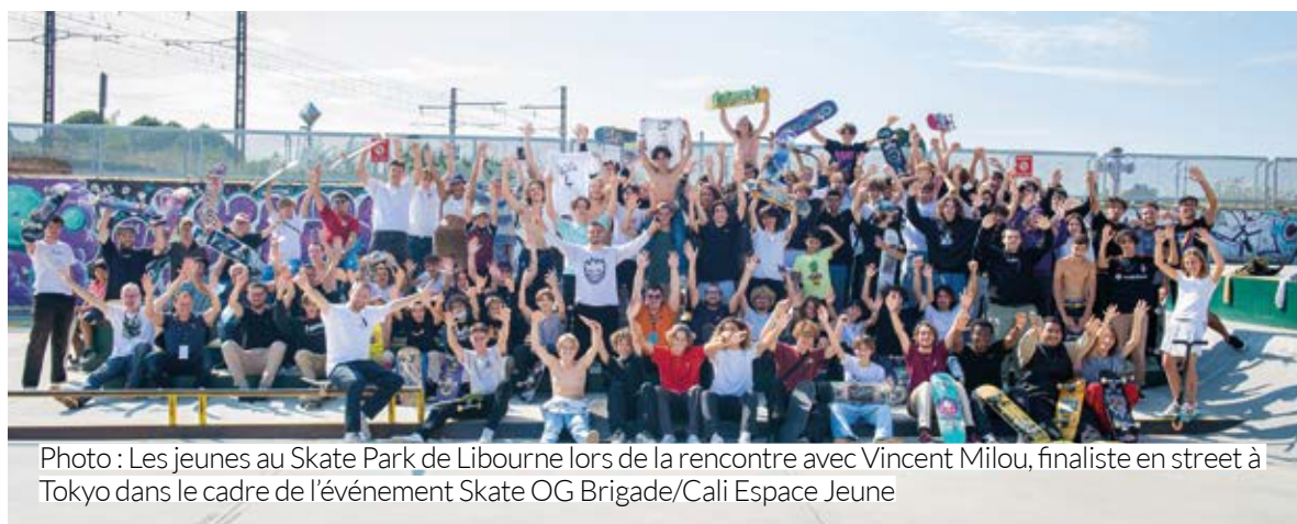
Photo : Les jeunes au Skate Park de Libourne lors de la rencontre avec Vincent Milou, finaliste en street à Tokyo dans le cadre de l'événement Skate OG Brigade/Cali Espace Jeune

Renseignements : Espace jeunes de Saint Denis de Pile 82, route de Paris / 05 57 74 61 94 / ejssaintdenisdepile@lacali.fr / Facebook : lacali.jeunesse