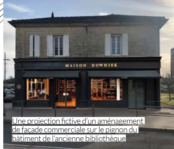
Une projection fictive d'un aménagement de façade commerciale sur le pignon du bâtiment de l'ancienne bibliothèque

Maintenant que la bibliothèque a déménagé, le travail pour convertir ce beau bâtiment central peut commencer. Le bureau d'étude missionné sur ce projet prépare le cahier des charges pour mener les travaux nécessaires à l'installation d'un restaurateur dans cet espace. « Outre l'aspect architectural remarquable et son positionnement central, c'est aussi le jardin public attenant qui constitue un atout indéniable pour la création d'un restaurant de qualité. Nous avons déjà des restaurateurs intéressés qui nous ont contactés pour ce projet », explique le maire.