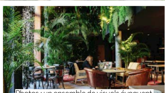
Photos : un ensemble de visuels évoquant l'ambiance créée au sein de la résidence