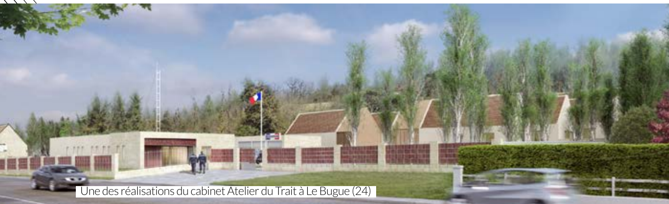
Une des réalisations du cabinet Atelier du Trait à Le Bugue (24)

« La concrétisation de ce projet (locaux de service et logements) constitue une excellente perspective pour notre territoire, sa population et les gendarmes de l'actuelle brigade de Guîtres, qui demeureront toujours compétents sur l'ensemble des douze communes dont ils ont actuellement la charge. En effet, l'accueil du public sera pleinement adapté, les conditions de travail dans des locaux neufs nettement améliorées, tout comme les conditions de vie des militaires et de leurs familles dans des logements modernes et totalement aux normes. Le fait de regrouper l'ensemble des personnels sur un seul site et de ne plus disposer de prises à bail hors caserne permettra d'augmenter la qualité de la réponse opérationnelle au quotidien. Je salue à ce titre le plein engagement de la commune de Saint Denis de Pile ».