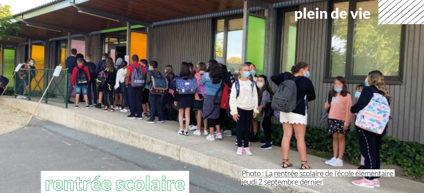
Photo : La rentrée scolaire de l'école élémentaire jeudi 2 septembre dernier