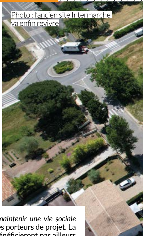
Photo : l'ancien site Intermarché va enfin revivre

1553 habitants DE PLUS DE 60 ANS SUR LA COMMUNE