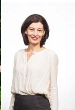
Fabienne Fonteneau, Maire de Saint Denis de Pile