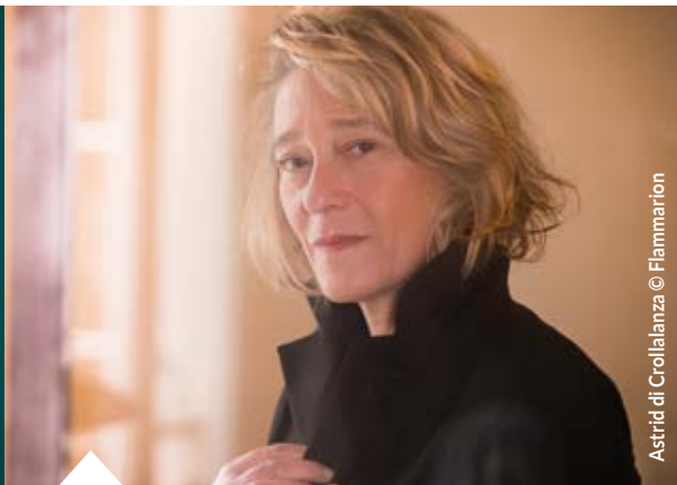
Astrid di Crollanza © Flammarion

Spectacle présenté : « L'ascenseur est au bout du couloir » par La Compagnie Territoires de la Voix. Gratuit. Réservation conseillée au 05 57 55 19 45.