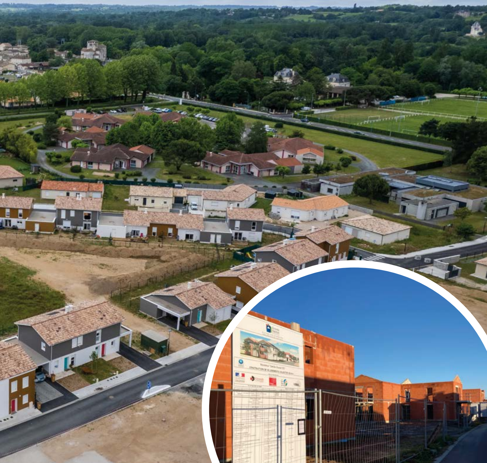
Photo : Juin 2022 - le nouveau quartier Camille Claudel proche du bourg.