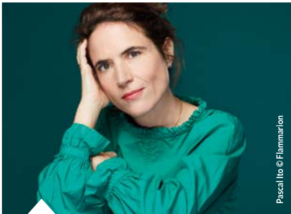
Pascal Ito © Flammarion

CÉRÉMONIE DES VŒUX À A POPULATION MAISON DE L'ISLE | 18h30 Accès libre.