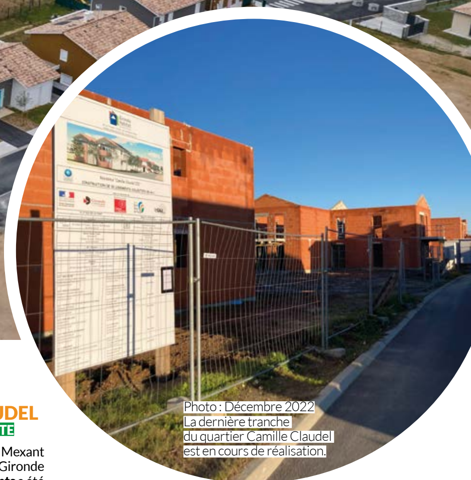
Photo : Décembre 2022 La dernière tranche du quartier Camille Claudel est en cours de réalisation.